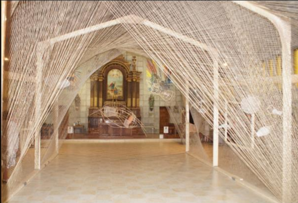
Dans l'église de Saint Pierre Le Vigier